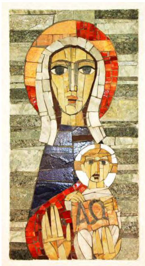
Bild: Martin Manigatterer (Foto) / Künstler unbekannt In: Pfarrbriefservice.de

fung auf eine ganz moderne Art: Meditation. Mit Maria schauen wir auf Jesus. Und wie Maria lernen wir Jesus kennen. Nicht schlimm, wenn Plätze frei bleiben bei den Andachten, wenn nur wir selbst hoffentlich dort nicht fehlen.