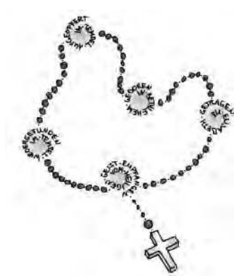
Grafik: Sarah Frank In: Pfarrbriefser-

Wir beten im November für alle unsere verstorbenen Familienangehörigen, Freunde und Bekannte, für alle Todesopfer von Naturkatastrophen das Gesätz: „... Jesus, der von den Toten auf- erstanden ist.“