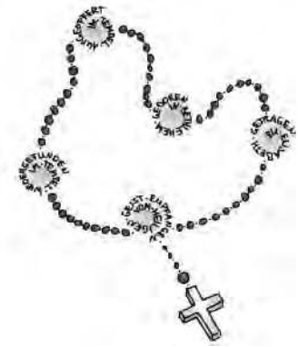
Grafik: Sarah Frank In: Pfarrbriefser-

Wir beten im Dezember für alle Menschen, die auf der Flucht vor Gewalt und Hass, vor Ungerechtigkeit und Ausbeutung, vor Naturkatastrophen und schweren Unglücken sind, das Gesätz: „... Jesus, der in Bethlehem geboren wurde.“