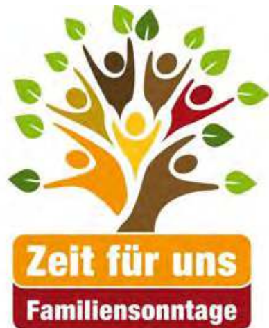
Grafik: Bistum Erfurt In: Pfarrbriefservice.de